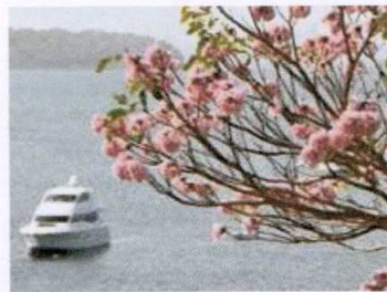
Panamá planifica extraño desarrollo turístico.