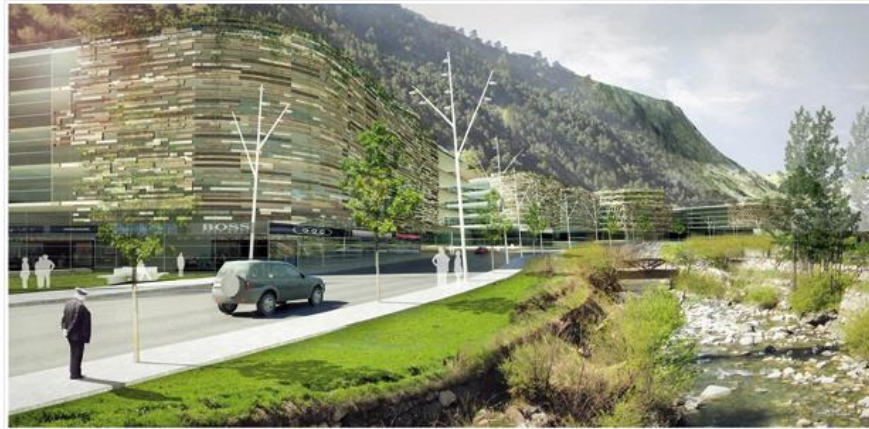
Una imatge virtual de la nova urbanització que se situarà a la carretera que connecta Encamp amb Escaldes-Engordany